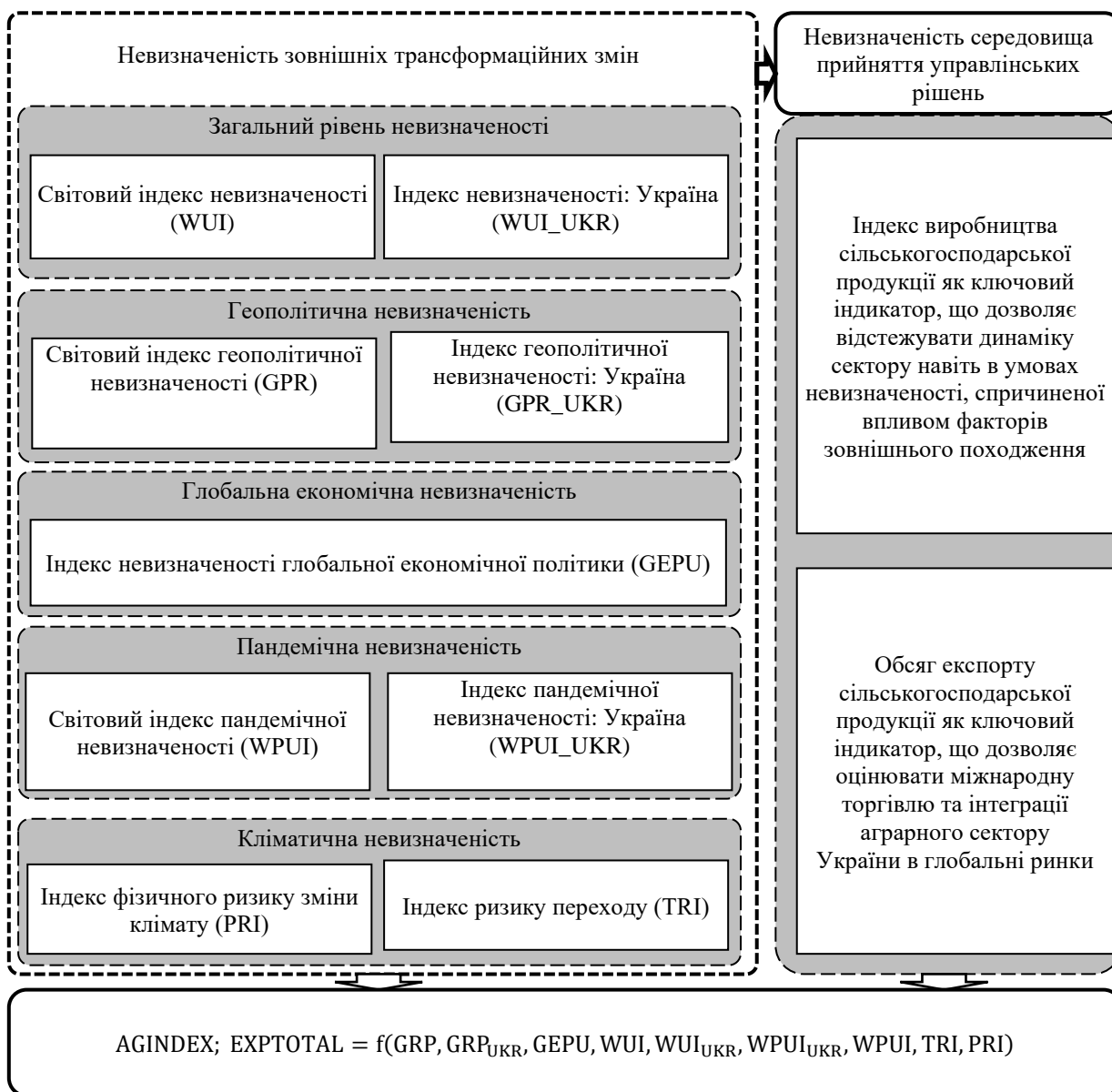
Рисунок 1 – Зв’язки між невизначеністю та показниками аграрного сектору (розроблено автором)

- Системи раннього попередження: Впровадження систем моніторингу для прогнозування погодних катаклізмів, зміни ринкових умов та інших ризиків. Це дозволить фермерським господарствам швидше реагувати на зміни та планувати заходи щодо їх мінімізації.