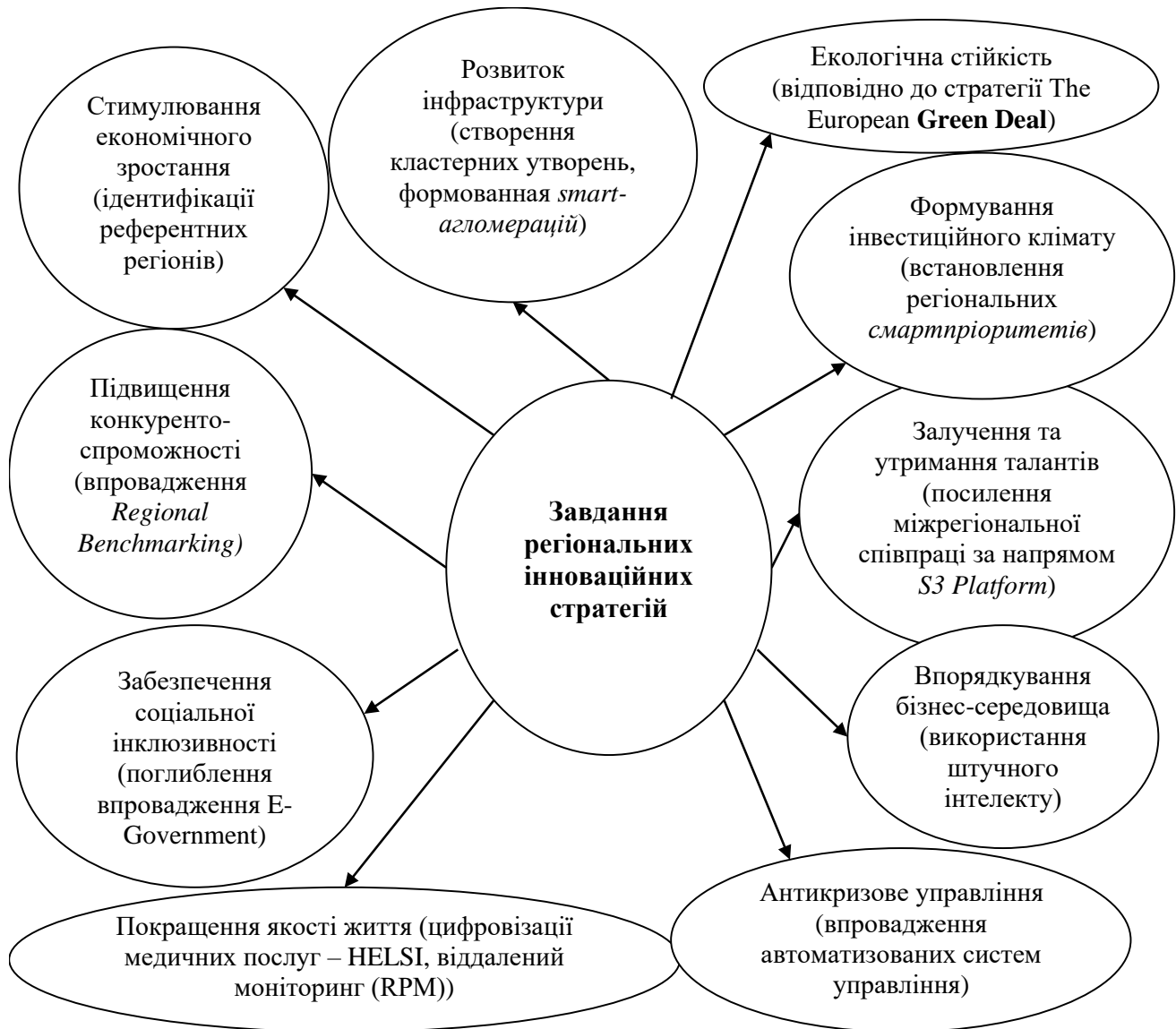
Рис. 2. Основні завдання регіональних інноваційних стратегій