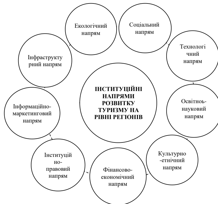
Рис. 2. Інституційні напрями розвитку туризму на рівні регіонів