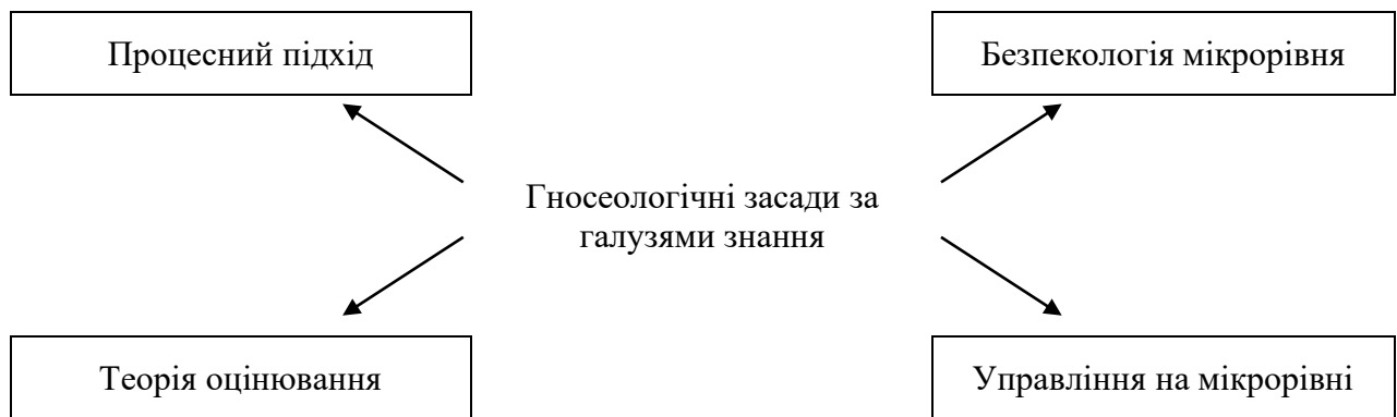
Рис. 2. Структуризація змістовних гносеологічних концептів у складі гносеологічних засад управління бізнес-процесами у забезпеченні економічної безпеки підприємства за галузями знання (запропоновано автором)