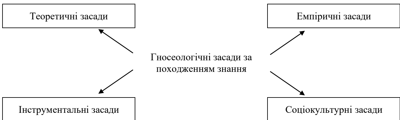
Рис. 3. Структуризація змістовних гносеологічних концептів у складі гносеологічних засад управління бізнес-процесами у забезпеченні економічної безпеки підприємства за джерелами походження знання (запропоновано автором)