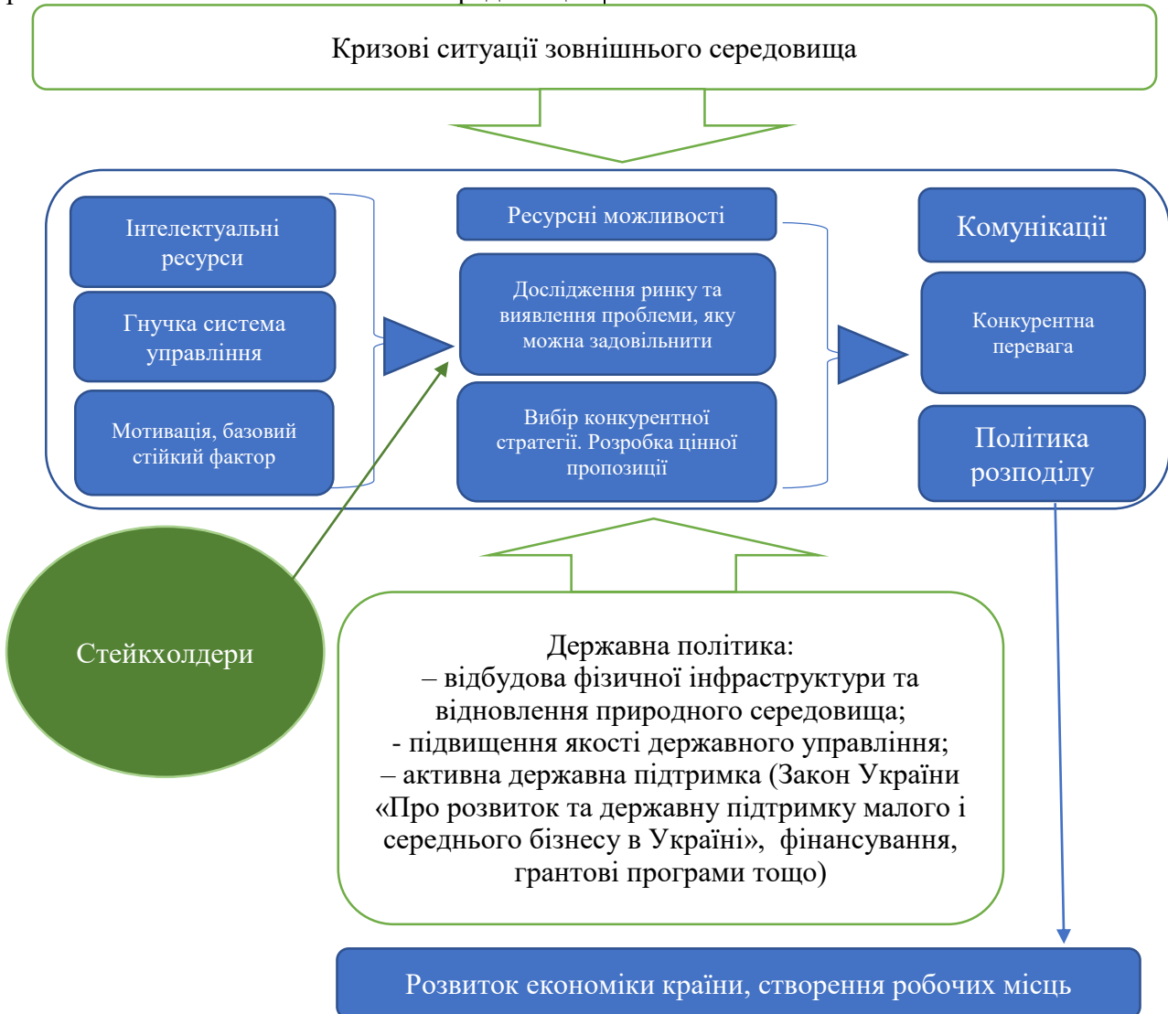
Рис. 2 Механізм формування конкурентної політики малого підприємництва

доцільно розглядати із застосуванням положень теорії зацікавлених осіб (стейкхолдерів). Концепція дає змогу діагностувати ключових зацікавлених осіб і оцінити їх вплив на реалізовані економічними суб'єктами проекти [8].