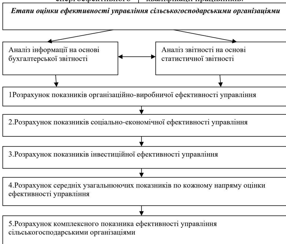
Рис. 1 Поетапне оцінювання ефективності управління сільськогосподарськими організаціями